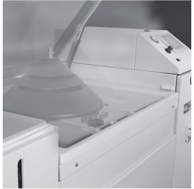
Test de niebla salina | FLORIDATEST

La alta calidad de estos tratamientos está confirmada por los exitosos resultados del test de niebla salina (los productos sobrepasan ampliamente las 2.500 horas) y las estrictas pruebas internacionales entre las que se encuentra el TEST FLORIDA.